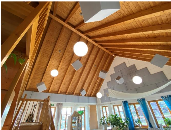
Neue Beleuchtung im Kindergarten Rathsmannsdorf

In ausgewählten Bereichen der Kindergärten der Marktgemeinde Windorf soll die Beleuchtung auf LED-Technik umgestellt werden. Der Austausch der Beleuchtung ist in diesen Bereichen erforderlich, da die eingesetzten Leuchten bereits ein hohes Alter aufweisen und teilweise die geforderte Beleuchtungsstärke unter den vorgeschriebenen Werten liegt. Das Förderprogramm gibt dem Vorhaben der Marktgemeinde Windorf neue Impulse. So können durch die Förderquoten von 30% mehr Leuchten saniert bzw. ausgetauscht werden als es in der ursprünglichen Absicht der Kommune lag. Nach erfolgreichem Abschluss der Arbeiten sollen die Ergebnisse zusammengestellt und bekannt gemacht werden. Diese sind Einsparung der elektrischen Energie, Absenkung des Beleuchtungsstärkeniveaus bei Tageslicht, Minderung der CO 2 -Emissionen sowie die tatsächliche Amortisationszeit des Vorhabens.