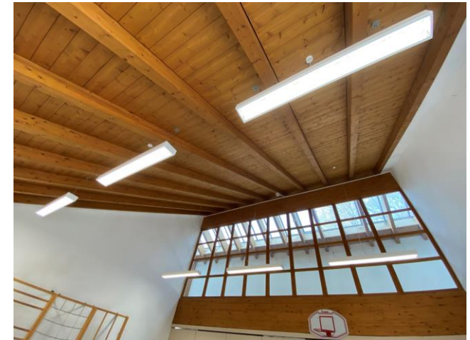
Neue Beleuchtung im Kindergarten Windorf

Ziel der Marktgemeinde Windorf ist es, durch die Anpassung der vorhandenen, veralteten und mit einem hohen Energieverbrauch gekennzeichnete Beleuchtung in den Kindergärten auf den aktuellen Stand der Technik, einen wesentlichen Teil zur Minderung von CO 2 -Emissionen und damit zum Klimaschutz beizutragen. Durch den geringeren Energieverbrauch können außerdem Stromkosten eingespart werden. Aufgrund der hier eingesetzten, neuartigen LED-Technik kann beispielsweise flexibel auf unterschiedliche Tageszeiten reagiert werden. So kann die Beleuchtungsstärke durch den Einbau dimmbarer Leuchten bewusst an diese Zeiten angepasst werden. Des Weiteren weisen diese Leuchten einen weitaus höheren Wirkungsgrad und eine höhere Lebensdauer als die bestehende Beleuchtung auf.