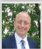
Franz Langer Erster Bürgermeister