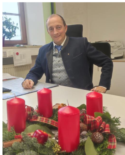
Franz Langer Erster Bürgermeister