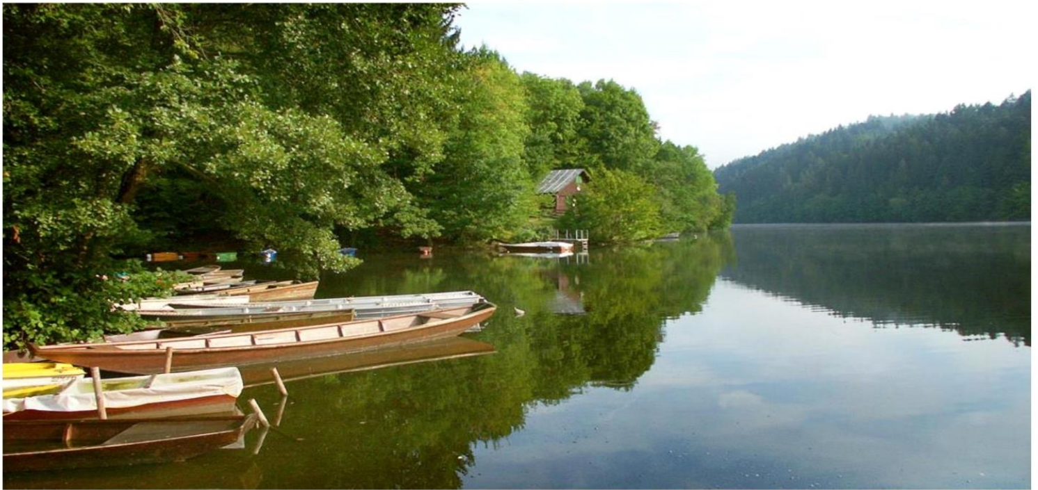
Am Ilztalstausee wird im Bereich „Mausmühle“ ein Badeeinstieg entstehen und eine WC-Anlage errichtet.

Kreative, nützliche und attraktive Projekte für viele Zielgruppen