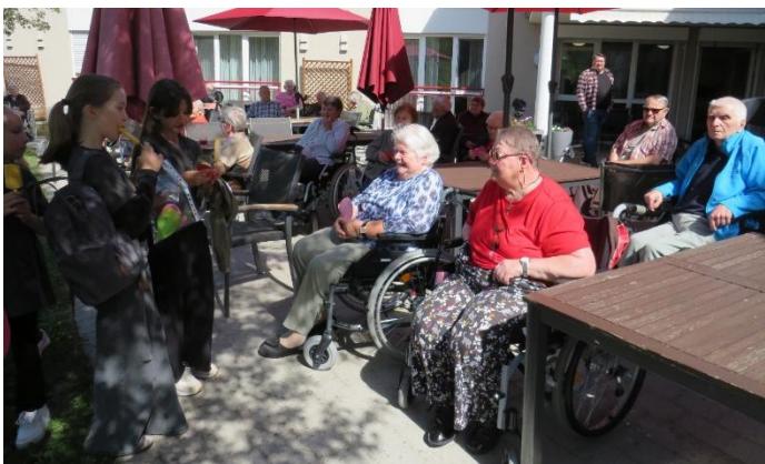
Verteilung der Papierherzen mit persönlichen Botschaften